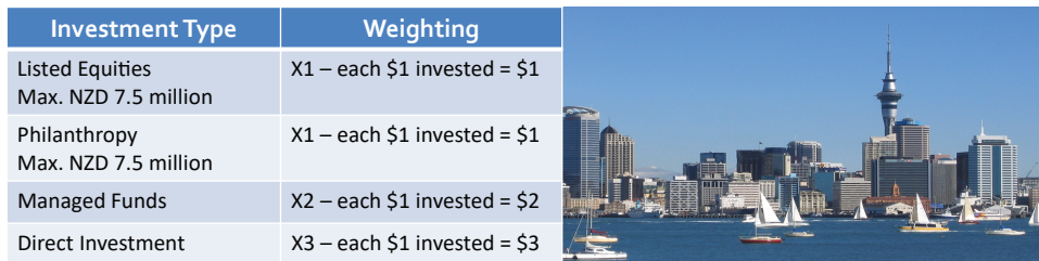
投資項目及有關的比例

第三步 準備資金證明文件，證明申請者投資資金是合法擁有，包括受贈的資金來源證明。並準備遞交文件等候移民局審核。